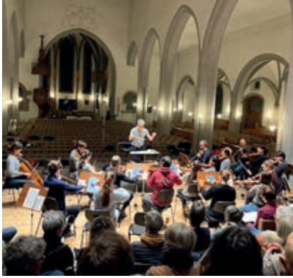
Blick auf den Chor und das Orchester mit Dirigent während der Probe in der Kirche St. Johann