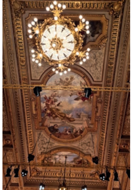
Die kunstvoll gestaltete Decke in der Tonhalle Zürich

Das attraktive und bunte Programm umfasste Männerchor-Klassiker wie den „Jägerchor“ aus dem Freischütz , den „Matrosenchor“ aus Der Fliegende Holländer und den „Pilgerchor“ aus Tannhäuser über Verdi („Ernani“, Einleitungschor der Räuber ) und Berlioz ( Die Verdammnis des Faust ) bis