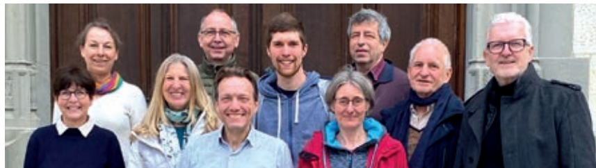
Die Konstanzer Gastsängerinnen und Gastsänger am Probenwochenende auf der Musikinsel Rheinau

Konstanzer Gastsängerinnen und Gastsänger beim Schaffhauser Oratorienchor