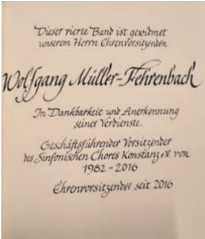
Die Widmung für Wolfgang Müller-Fehrenbach auf der dritten Seite des neuen „Goldenen Buchs“