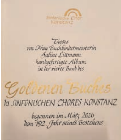
Die Inschrift auf der zweiten Seite des neuen „Goldenen Buchs“

sondern auch weit über die Stadt- und Landesgrenzen hinaus Partnerschaften mit Chören in England, Frankreich und Ungarn pflegt und Kontakte zu mehreren Chören in der Schweiz unterhält.