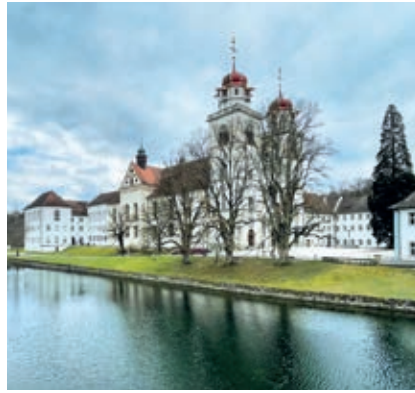
Die Musikinsel Rheinau in der Nähe von Schaffhausen

Gelegenheit, dort zu übernachten, was einige Konstanzer Sänger in Anspruch nahmen.